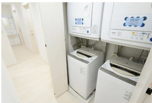
共用スペースイメージ