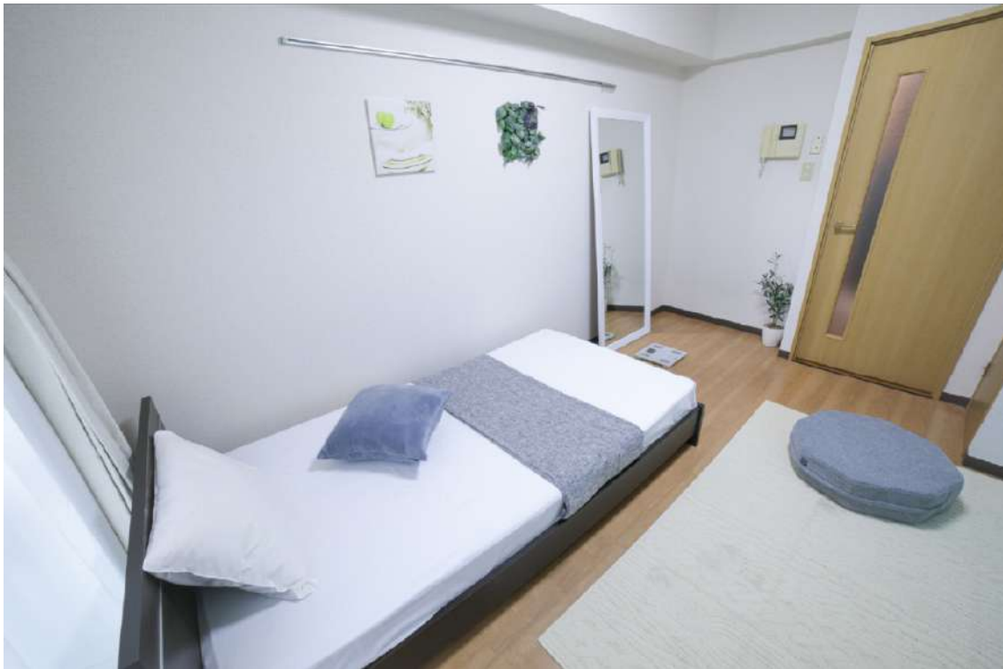
いつでも好きな時間に自然とエクササイズしたくなるお部屋