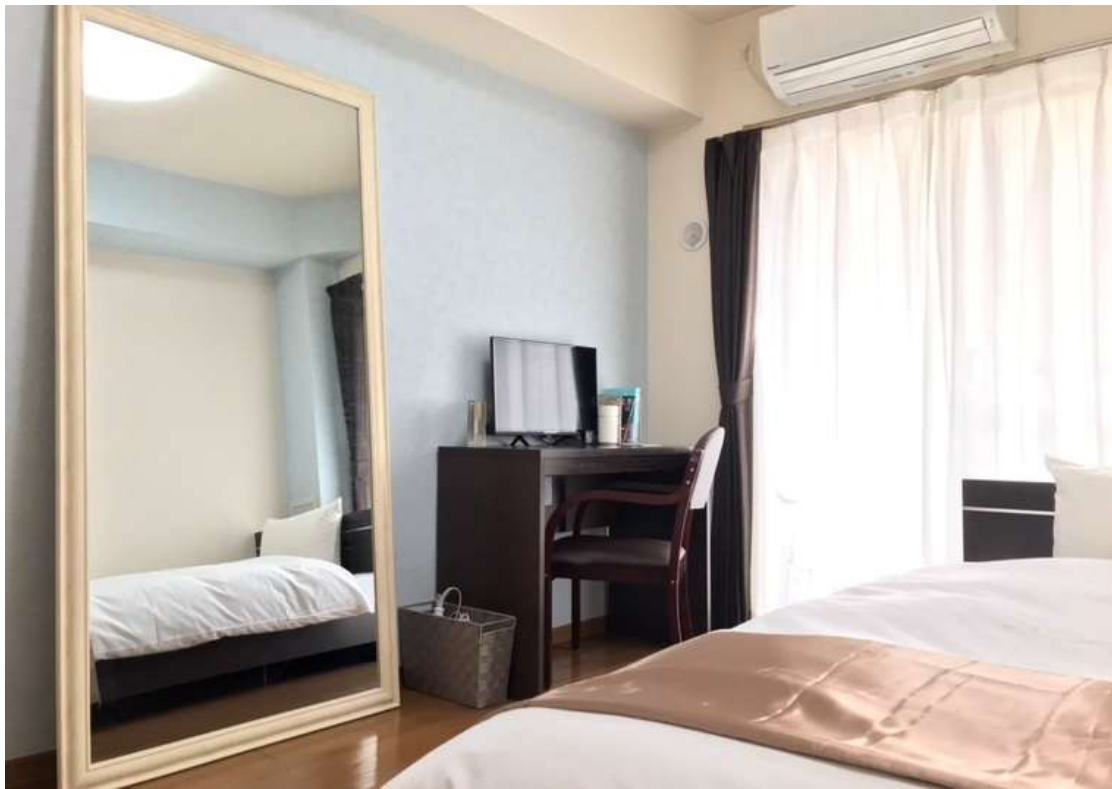
大きな鏡があり、日頃から美意識が高くなるお部屋