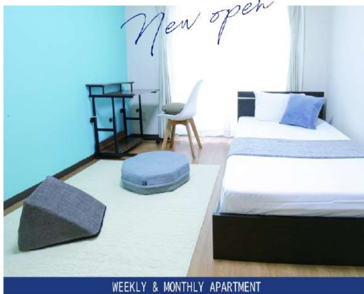
「ジムテリア」とコラボした、自分の健康を意識できるコンセプトルーム