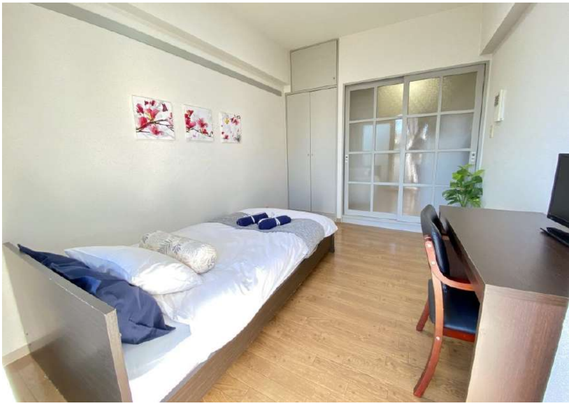
全室、新耐震基準をクリアした「マンションタイプ」