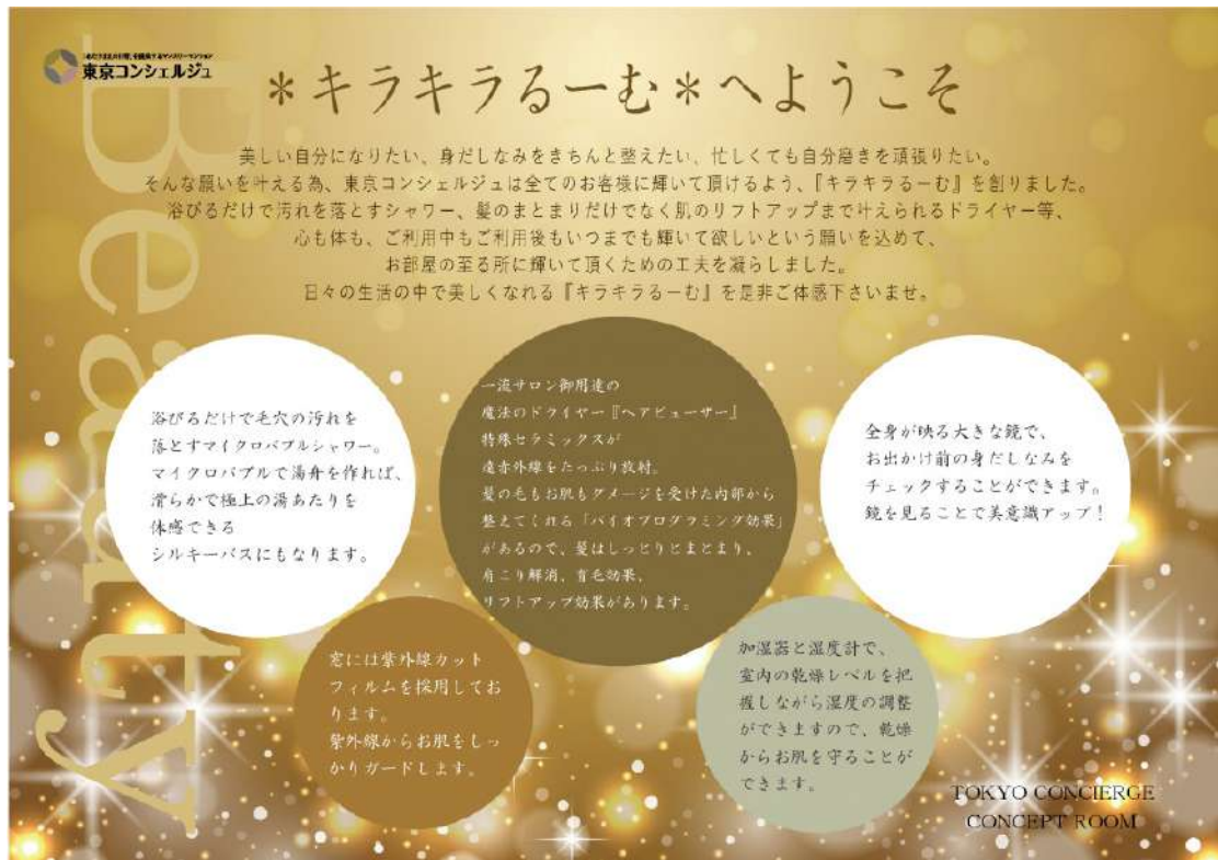
自分磨きをしたい人にぴったりなコンセプトルーム