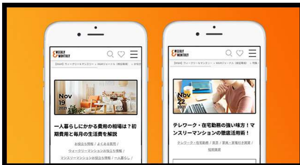
リニューアル後のスマホ表示イメージ