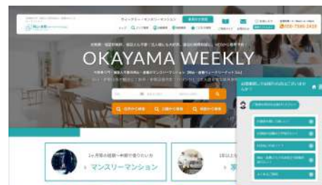
岡山・倉敷ウィークリードットコム