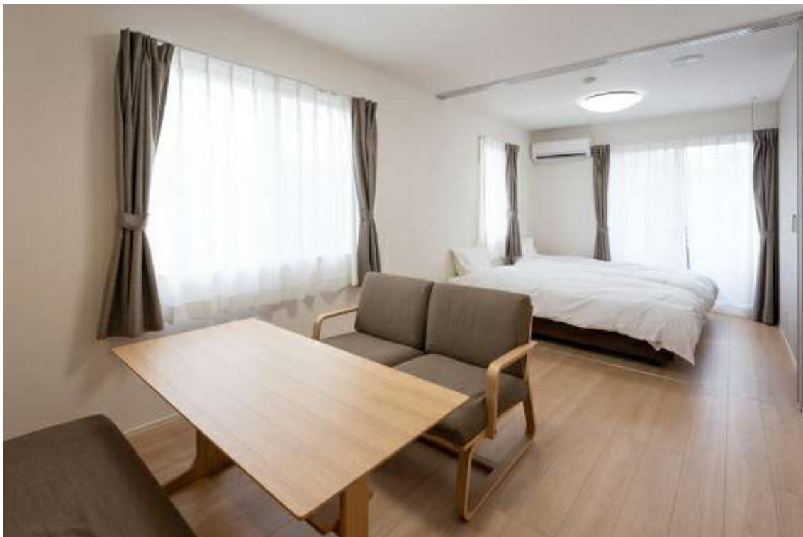
落ち着いた雰囲気の広々LDKタイプ

新型コロナウイルスの第3波、第4波の感染拡大を受け、テレワーク・リモートワークやワーケーション、多拠点生活といった新しい生活・働き方に対応できる物件に、引き続き注目が集まっています。W&Mでは、全国各地、インターネット環境が整ったお部屋や心地よく暮らせるお部屋など、ユーザーの様々なニーズに応えられる物件を多数取り揃えております。サイト内の物件詳細ページには地域情報も充実しており、知らない土地で物件を探す方でも安心してご利用いただけます。