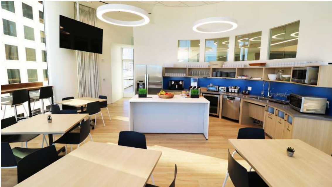
fabbit Global Gateway "San Francisco" 内観