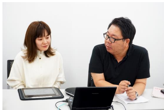
▲ Zoomにてオンライン配信

また、参加者のみなさまと意見交換をするなど、今後のマンスリー運用の方向性について議論しました。