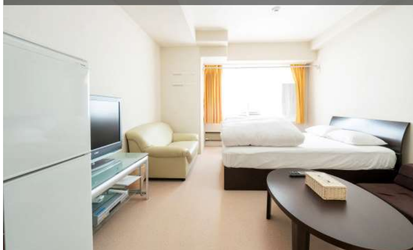
エンゼルリゾート湯沢：施設イメージ